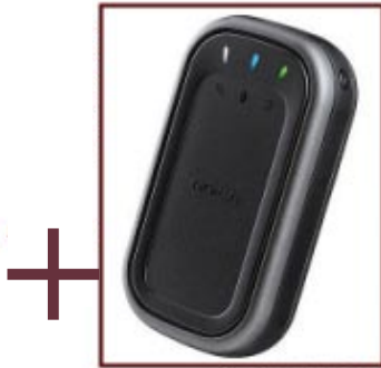
Antenne GPS SIRF III pour géolocalisation (optionnelle)